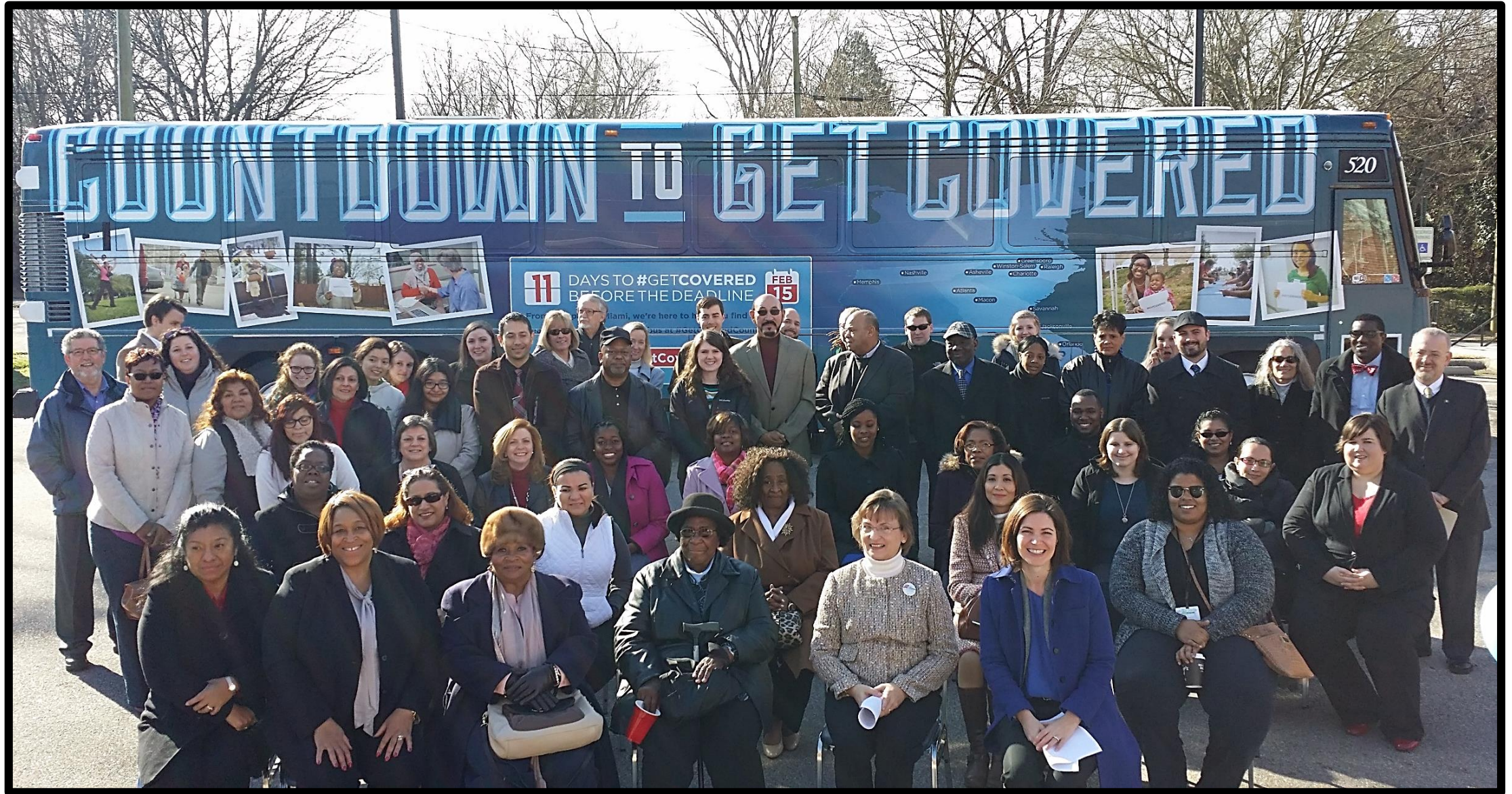
9:30am -- February 4, 2015 -- Martin Street Baptist Church, Raleigh