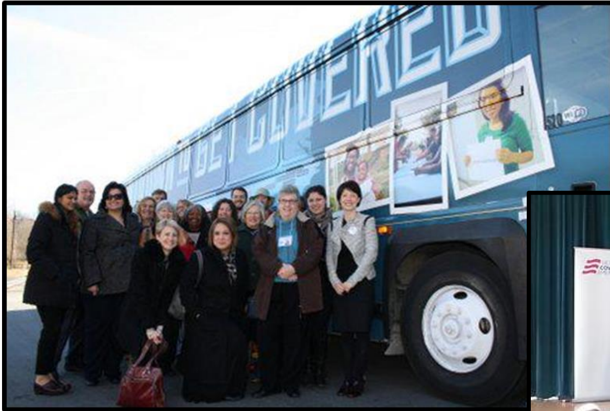
Pisgah Legal Services Assisters and Volunteers