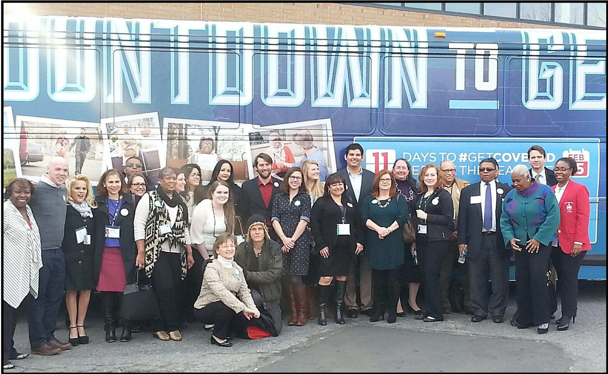
Charlotte – February 4, 2015 - 2:30pm