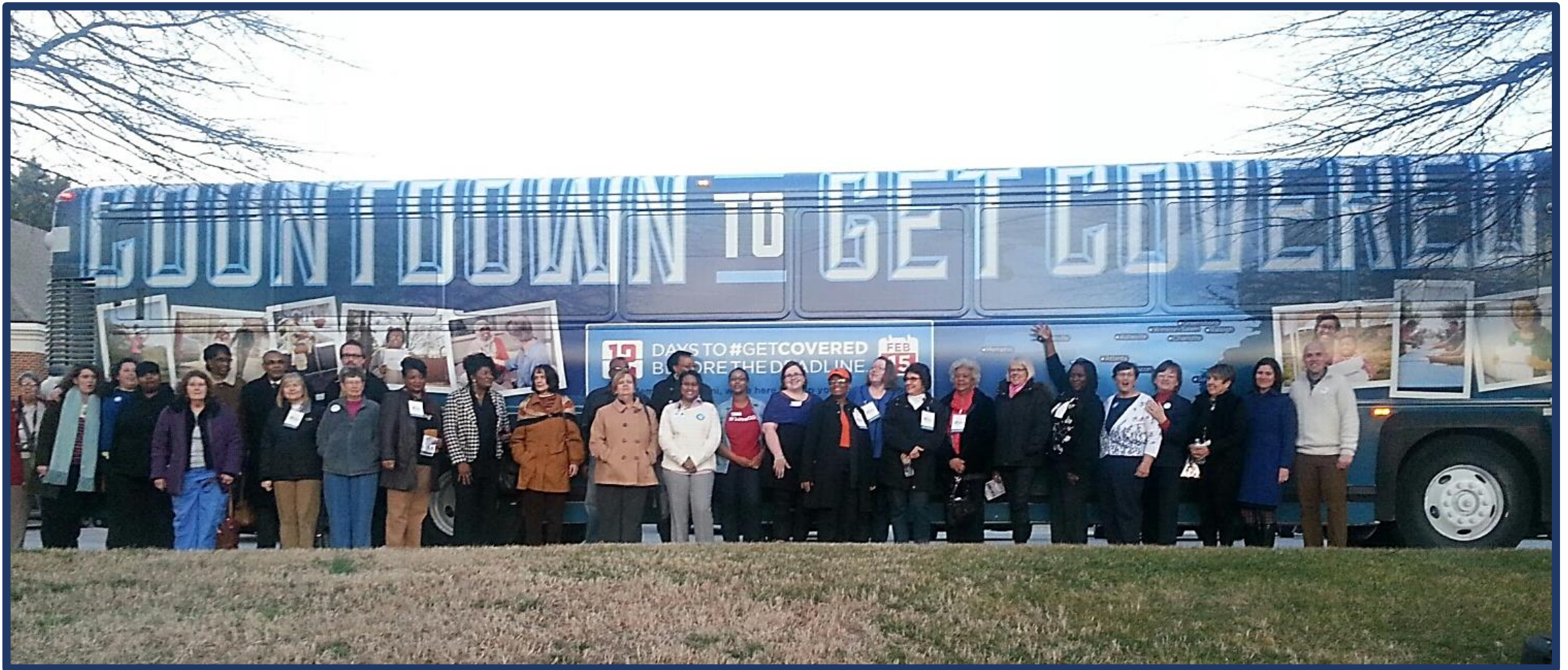
Greensboro – February 3, 2015 Enrollments, Phone Banking and Media Event!